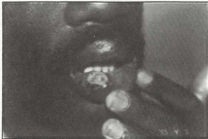
Foto 1 - Paciente HIV Positivo com lesões de Herpes

Paciente apresentou exame sorológico positivo para HIV