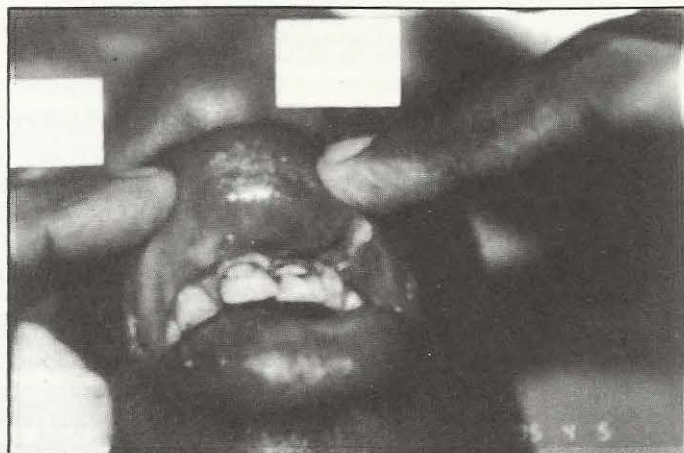
Foto 2 - Paciente HIV Positivo com lesões de Herpes