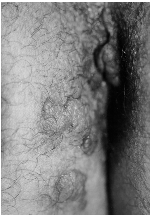
Fig. 2 - Notável remissão da sintomatologia uma semana após tratamento com azitromicina.